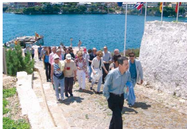
Els visitants arribaren a l'illa des del port de Maó.