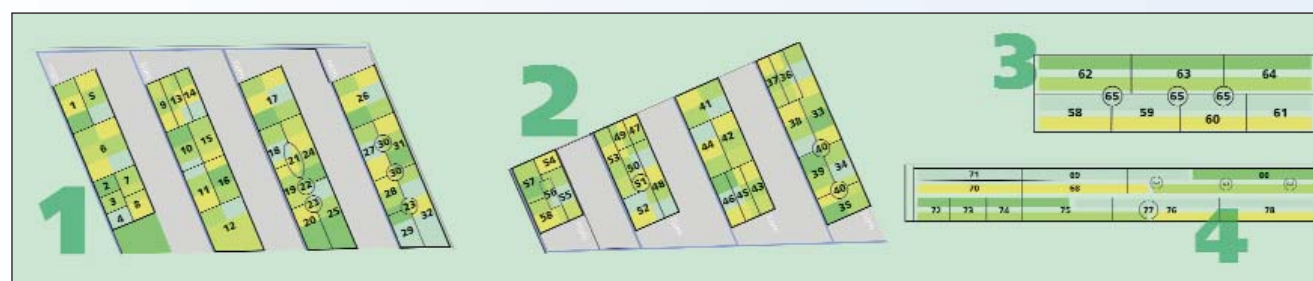
Plànol del jardí de plantes medicinals (detall).