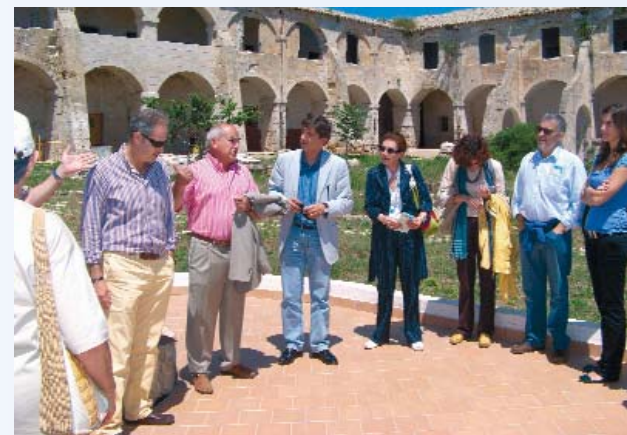
Els assistents comprovaren l'estat de les obres de rehabilitació de l'Hospital Illa del Rei.