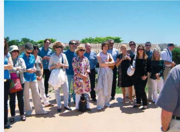
Representants de la Fundació Illa del Rei guiaren als visitants en la seva visita per les dependències de l'Hospital.