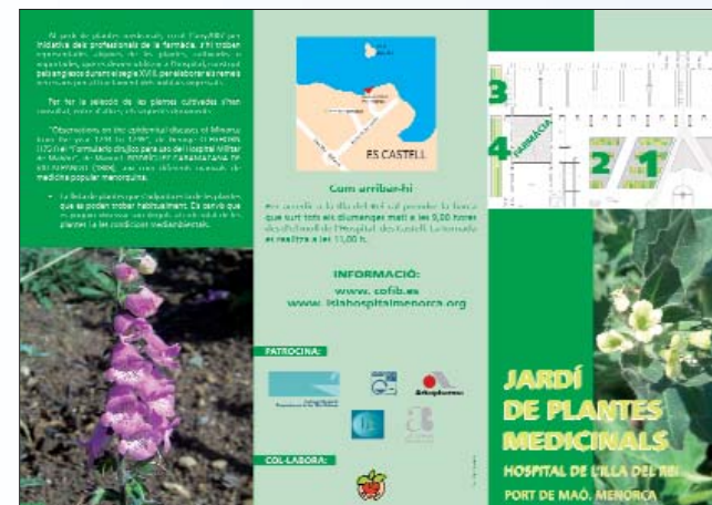
Triptic editat amb informació del jardí de plantes medicinals.