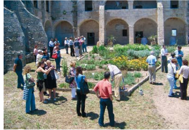
El Jardí de Plantes Medicinals ha estat finançat per la firma hotelera menorquina Artiem.