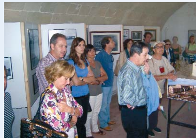
Diferents dependències del recinte ja han estat restaurades per part de diferents entitats i associacions.

Un cocktail en col·laboració amb el laboratori BAYER i un passeig en barca pel port de Maó completaren una jornada farmacèutica molt agradable i que, a més, l'acompanyà un temps esplèndid.