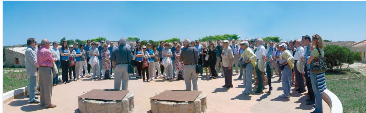
Gairebé cinquanta farmacèutics i acompanyats acudiren a les jornades.

accés al recinte, moment en què es donà per inaugurat el Jardí de Plantes Medicinals finançat per la firma hotelera menorquina Artiem.