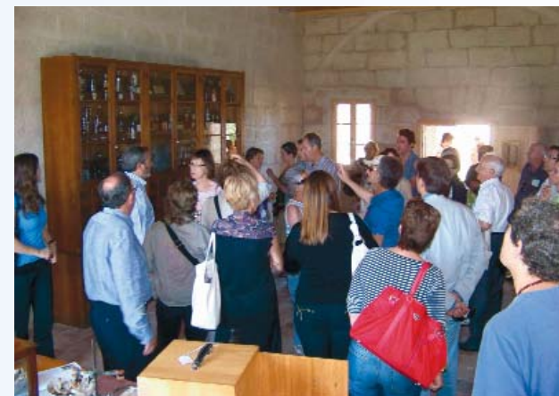
El museu de la farmàcia aviat serà una realitat gràcies a la col·laboració de diferents organitzacions farmacèutiques.