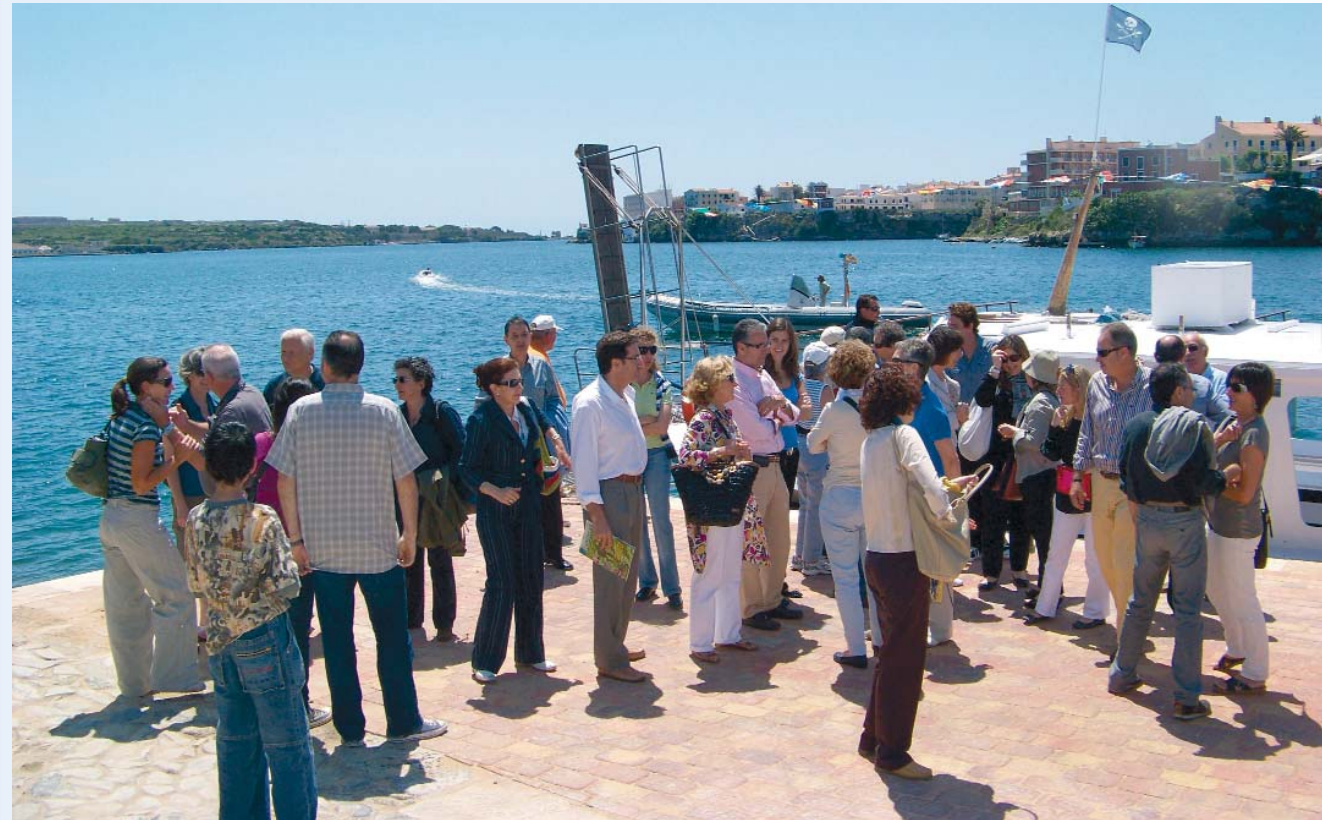
Un passeig en barca pel port de Maó completà una Jornada Farmacèutica i la inauguració del Jardí Botànic.

També s'han fet servir diferents manuals de medicina popular menorquina.