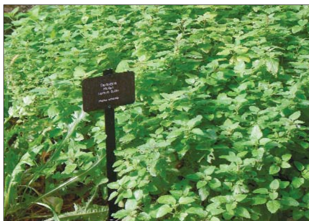
Jardí Botànic del Monestir de Pedralbes, Barcelona.