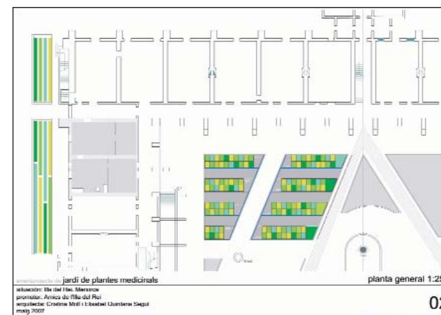
Avantprojecte del Jardí de Plantes Medicinals. (general).