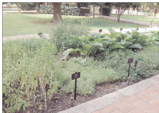
Jardí Botànic del Monestir de Pedralbes, Barcelona.