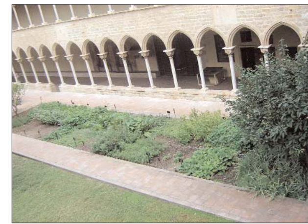
Jardí Botànic del Monestir de Pedralbes, Barcelona.