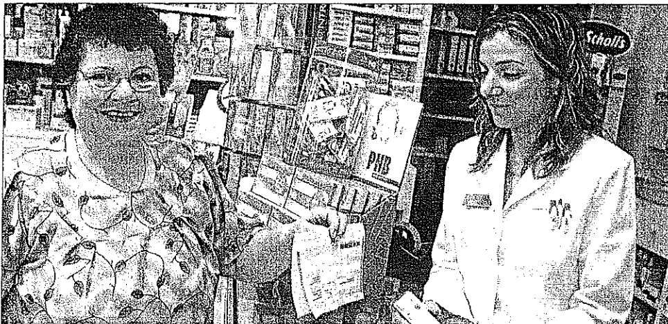
Una usuaria de la sanidad pública comprando un medicamento con receta en la farmacia Muret de Son Ferrñol.